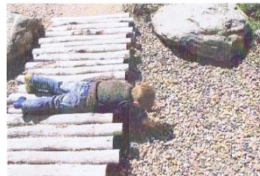
B) Boompalen pad, zand/grind/boomschors