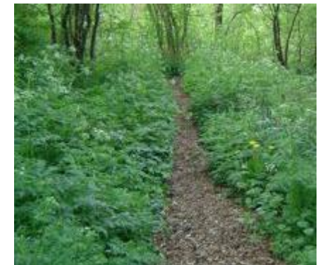
A) Mini wildernis pad