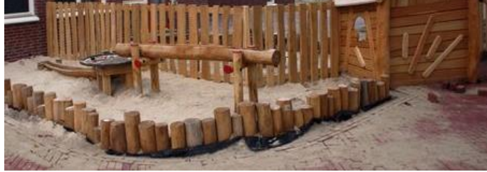
afscheiding dmv palenrij tussen D en E